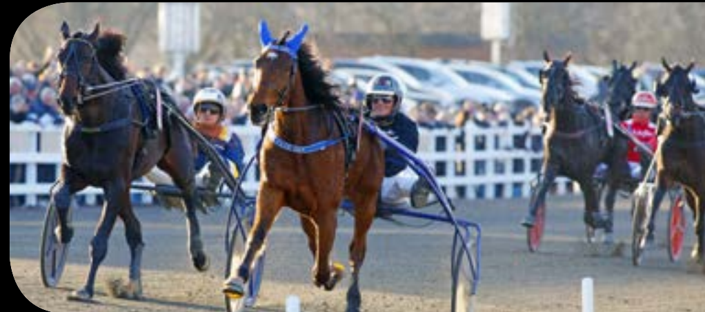
PRINS CARL PHILIPS JUBILEUMSPOKAL 2024 - A Fair Day - Oscar Ginman